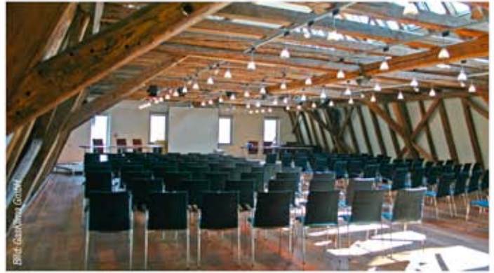
Alle Tagungs- und Konferenzräume sind klimatisiert.

• der Einbau einer mit der Abwärme aus der Mikrogasturbine angetriebenen Absorptionskältemaschine.