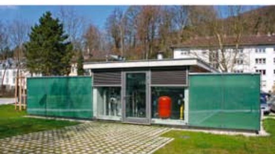
Die Energiezentrale ist außerhalb des Gebäudes in einem architektonisch ansprechenden Gartenpavillon untergebracht.