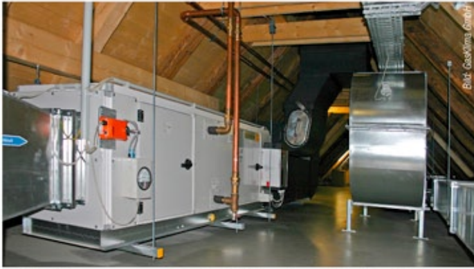
Um Schallübertragungen zu vermeiden, sind die Klimageräte am Dachstuhl aufgehängt.

Machbarkeit einer solchen Lösung. Im Vordergrund stehen die Erfahrungen mit dem Betrieb einer Erdgas-angetriebenen Mikrogasturbine und die Auskopplung von Wärme zur Kälteerzeugung mittels Absorber im Verbund mit der BHKW-Anlage eines Hallenbads.