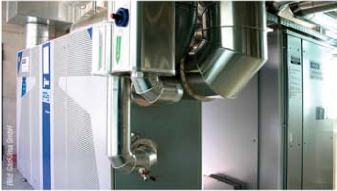
Kraft-Wärme-Kälte-Kopplung mit Mikrogasturbine Turbec NTM100 (links) und Yazaki WFC-SC 20 Absorptionskältemaschine von GasKlima (rechts).